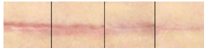
Slika: Povečana fotografija brazgotinjenja od 1 meseca do 3 let po operaciji

Natančna navodila in izdelke za nego brazgotin dobite v Juventina clinic.